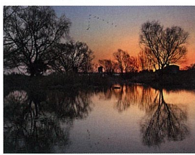
優秀賞 【早朝の多摩川畔】 野村 成次