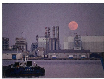
優秀賞 【スーパームーン】 藤枝 計夫