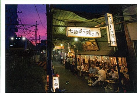
優秀賞 【昭和の風情】 南 司郎